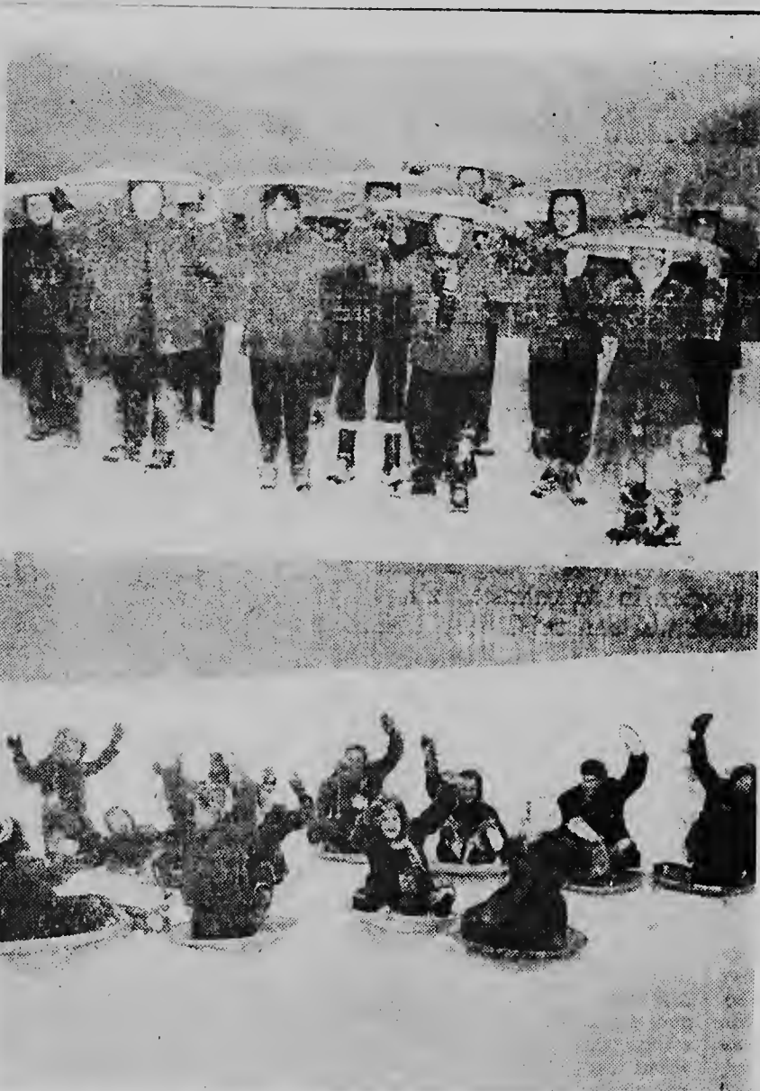
E grupo di muchanan mericano aki a descubri un clase di slee nobo...